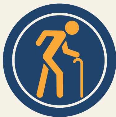
Idosos a partir de 60 anos