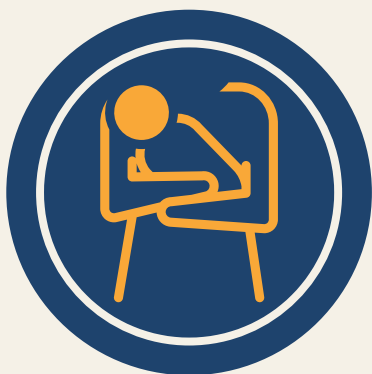
Pessoas com crianças de colo

Em atendimento ao Decreto-Lei n.º 58/2016, de 29 de agosto, a AADESAM concede atendimento prioritário aos seguinte grupos: