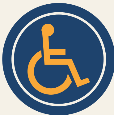
Pessoa com deficiência