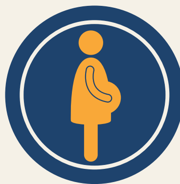
Grávidas / lactantes